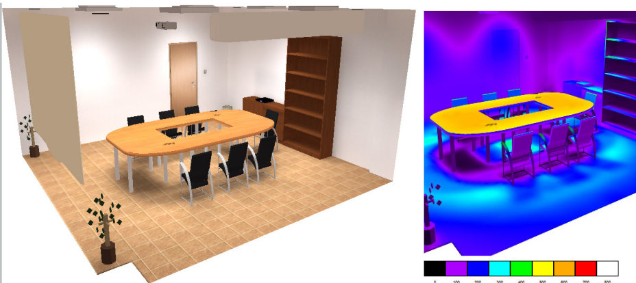
Rysunek 3. Przykładowa wizualizacja oświetlenia pomieszczenia biurowego – sala posiedzeń (a) i rozkład natężenia eksploatacyjnego oświetlenia (b).

Prawidłowo wykonane projekty oświetlenia wymagają dopracowania aranżacji wnętrz przez architektów, gdyż tylko wtedy można prawidłowo dobrać i rozmieścić oprawy oświetleniowe, które będą współgrały z pomieszczeniem. Wymaga to by architekci określili kolory ścian, sufitów i podłóg oraz określili struktury materiałów, z których zostały wykonane tak, aby spełniały one zalecenia normy [1].